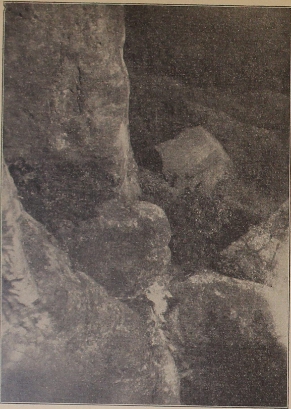
Der Horst vom benachbarten Felsen aufgenommen.

Heuscheuer 1933, (Original)