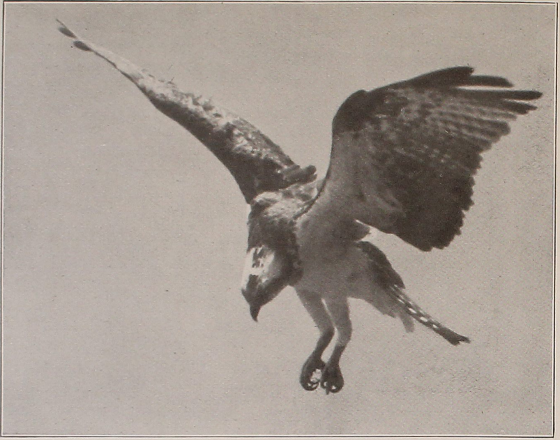
Fischadler rüttelt über dem See.