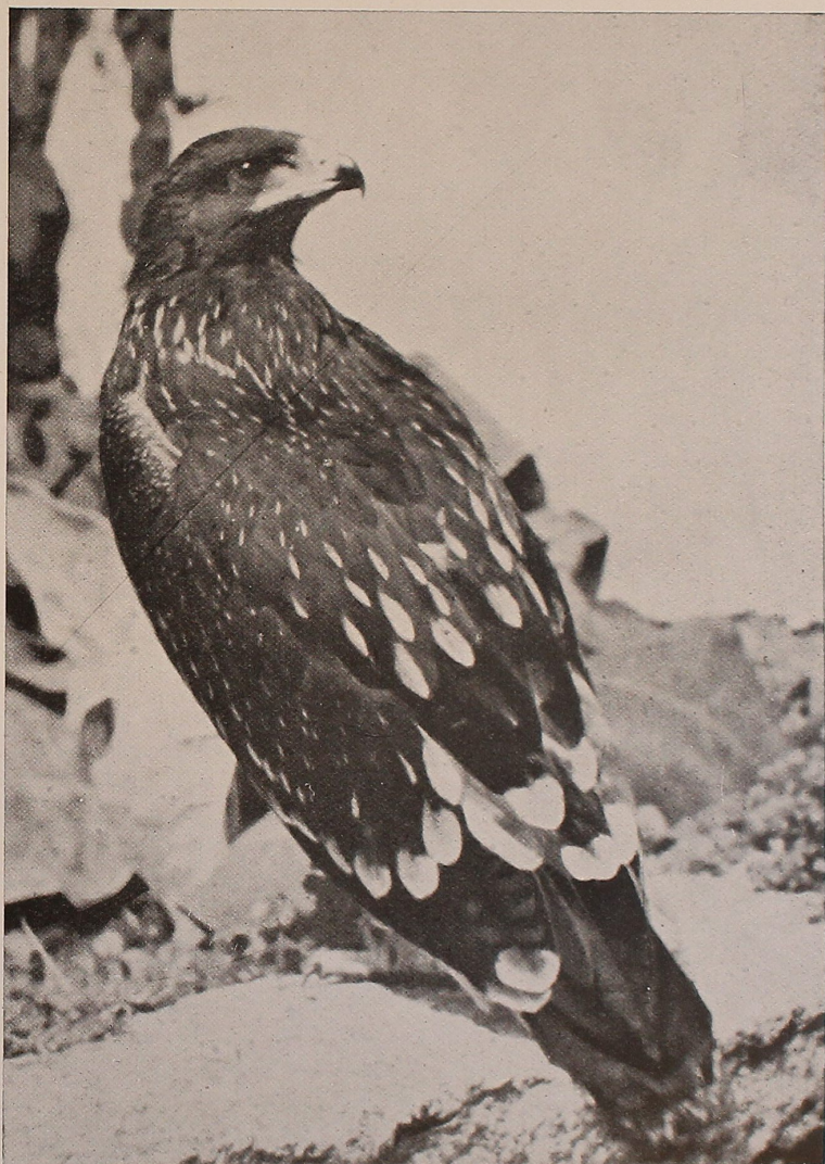
Schreiadler, Aquila pomarina L., aus einem Horst in der Bartschniederung, etwa 9 Wochen alt (16.8.1939)